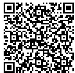
倉敷会場申込 QR コード

【申込】 https://forms.office.com/r/cgCqeFXRza 上記URL または QR コードよりお申込みいただけます。 *先着順にて定員となり次第締め切り